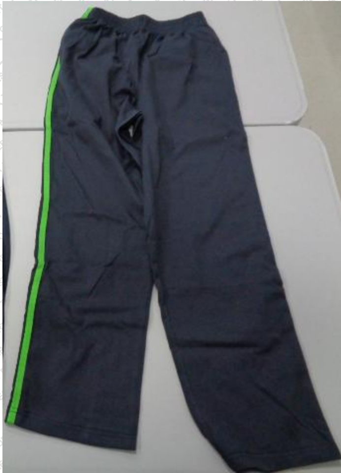
藏青嵌绿/灰条长裤